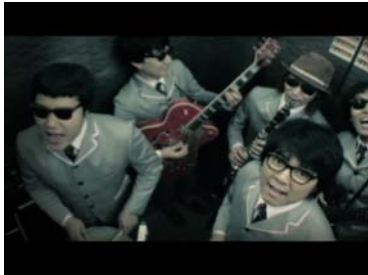
「INDIE TO GO」

さらに、昨年映画祭にて上映し、好評を博した、あの韓国中編ミュージックビデオの傑作「男が女を愛するとき(歌手:イ・スング)」をアンコール上映。